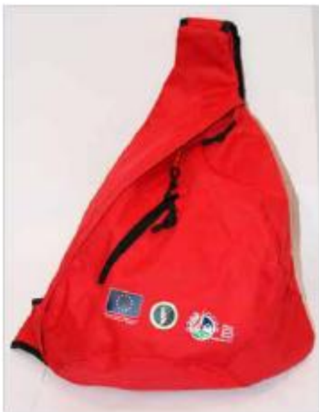
Plecaki - PRZYKŁADY: