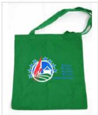
Torba płócienna zielona - PRZYKŁAD: