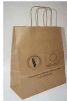
Torba papierowa - PRZYKŁAD: