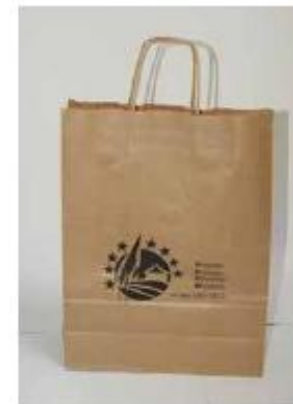
Torba papierowa - PRZYKŁAD: